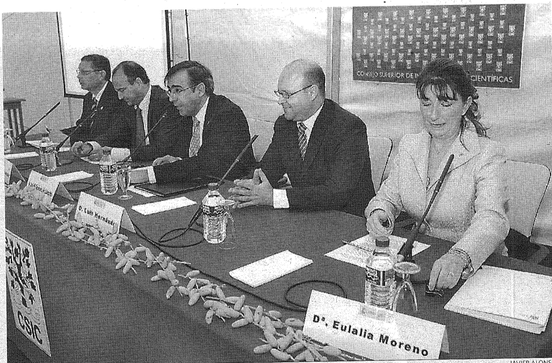
Commemoración del 60 aniversario de la Estación Experimental de Zonas Áridas.

La Estación Experimental de Zonas Áridas celebra su aniversario con la inauguración de la Semana de la Ciencia