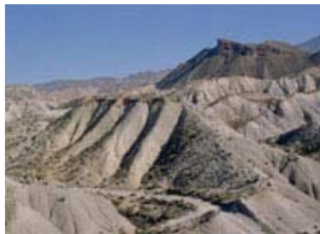
Desierto de Tabernas

El Banco de Recursos Genéticos de Fauna Amenazada del Parque de Rescate de la Hoya y las Estaciones de Campo se incluirán en el Centro Nacional EDB/CNBYC