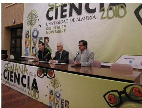
Inauguración de la Semana de la Ciencia

El bloque central de la Semana de la Ciencia, como en años anteriores, lo siguen realizando las distintas Facultades y Escuelas de la Universidad de Almería, que han preparado diversas actividades para que los alumnos amplíen sus conocimientos sobre la formación impartida en la UAL, tanto en el campo de las ciencias como en letras